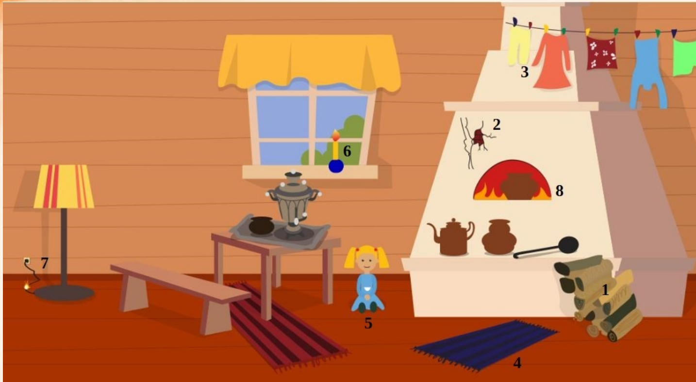
Рис. 1 Проверь найденные нарушения пожарной безопасности в доме