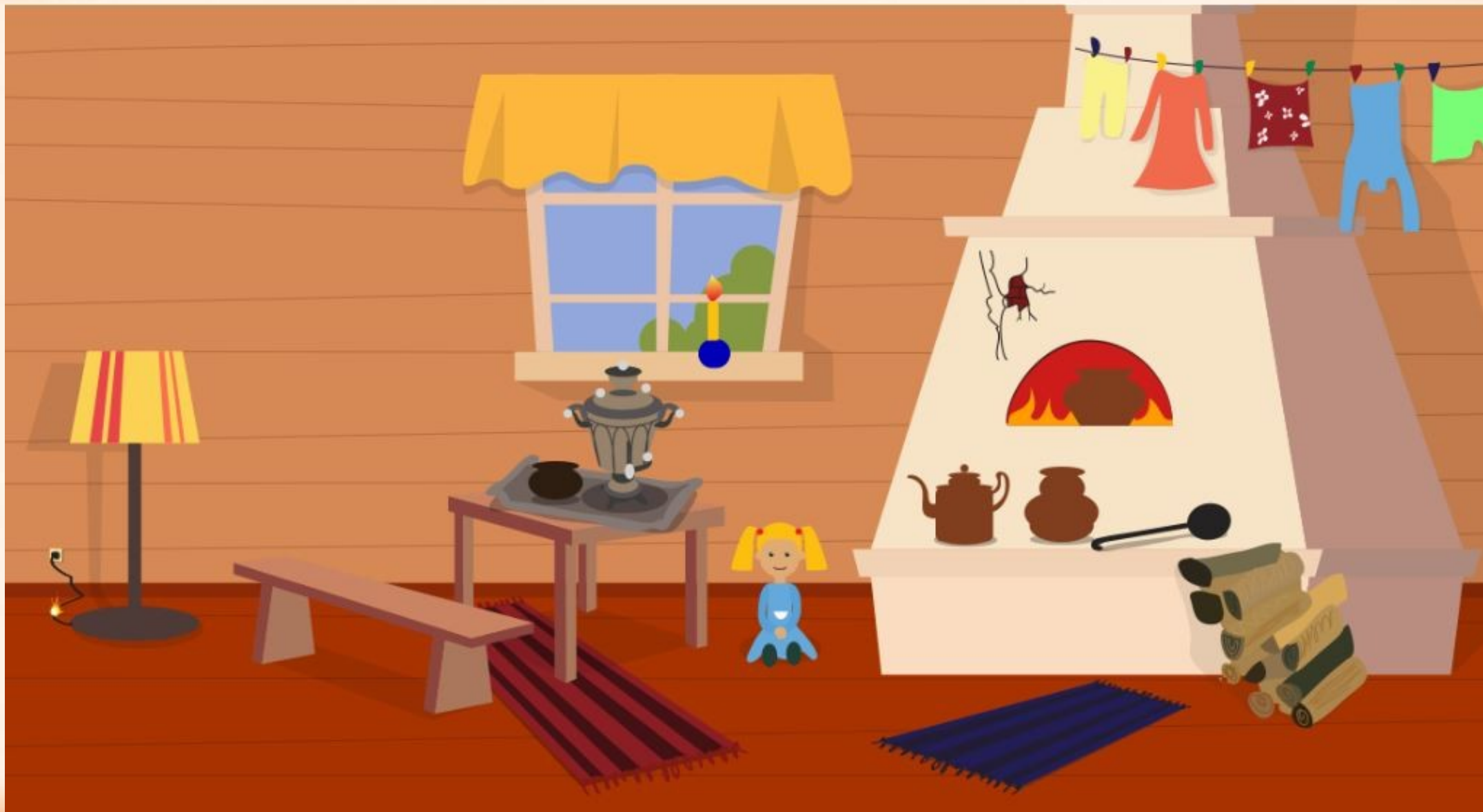
Рис. 1 Найди нарушения пожарной безопасности в доме (8 нарушений)