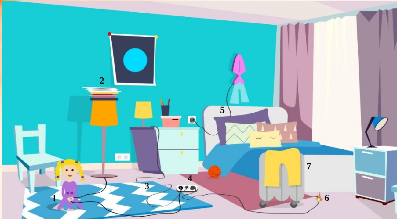
Рис. 5 Проверь найденные нарушения пожарной безопасности в детской