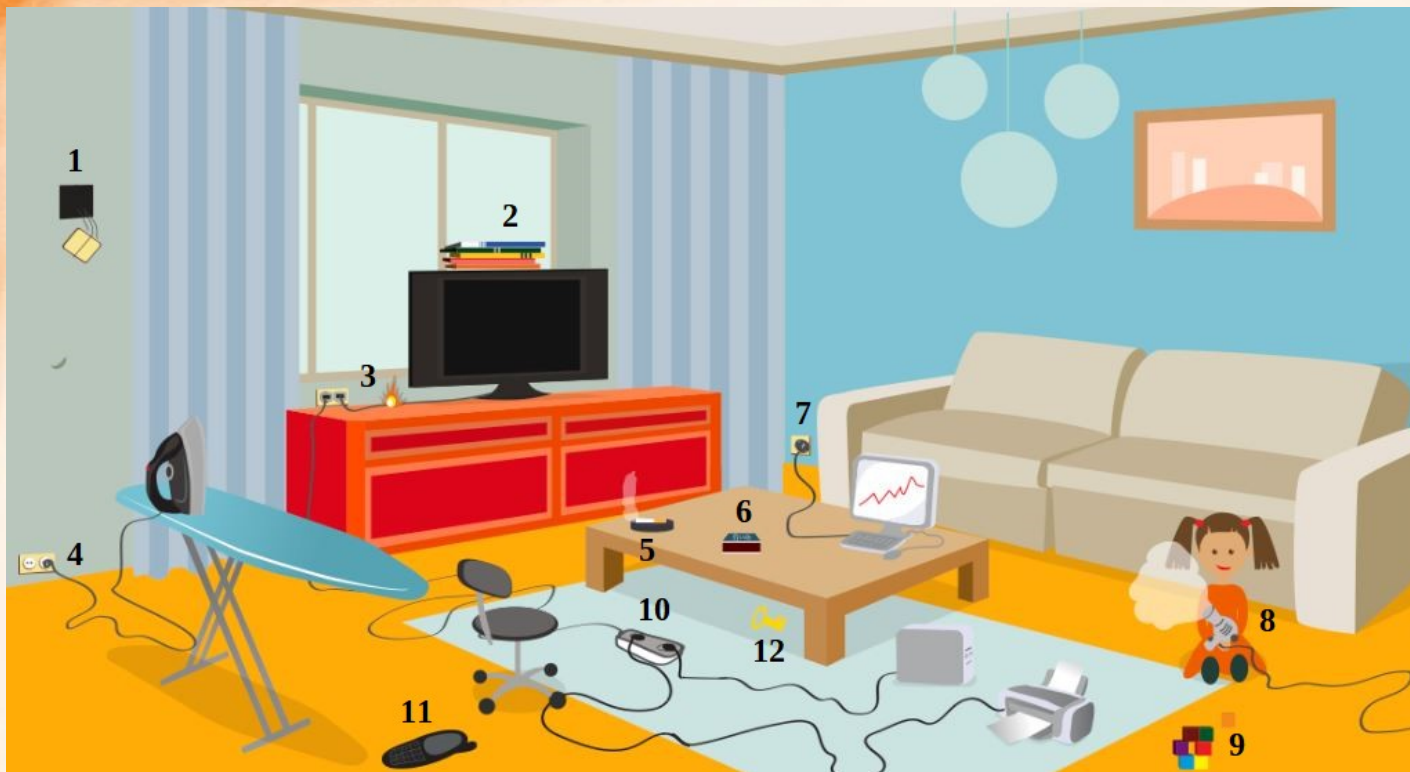
Рис. 3 Проверь найденные нарушения пожарной безопасности в гостиной