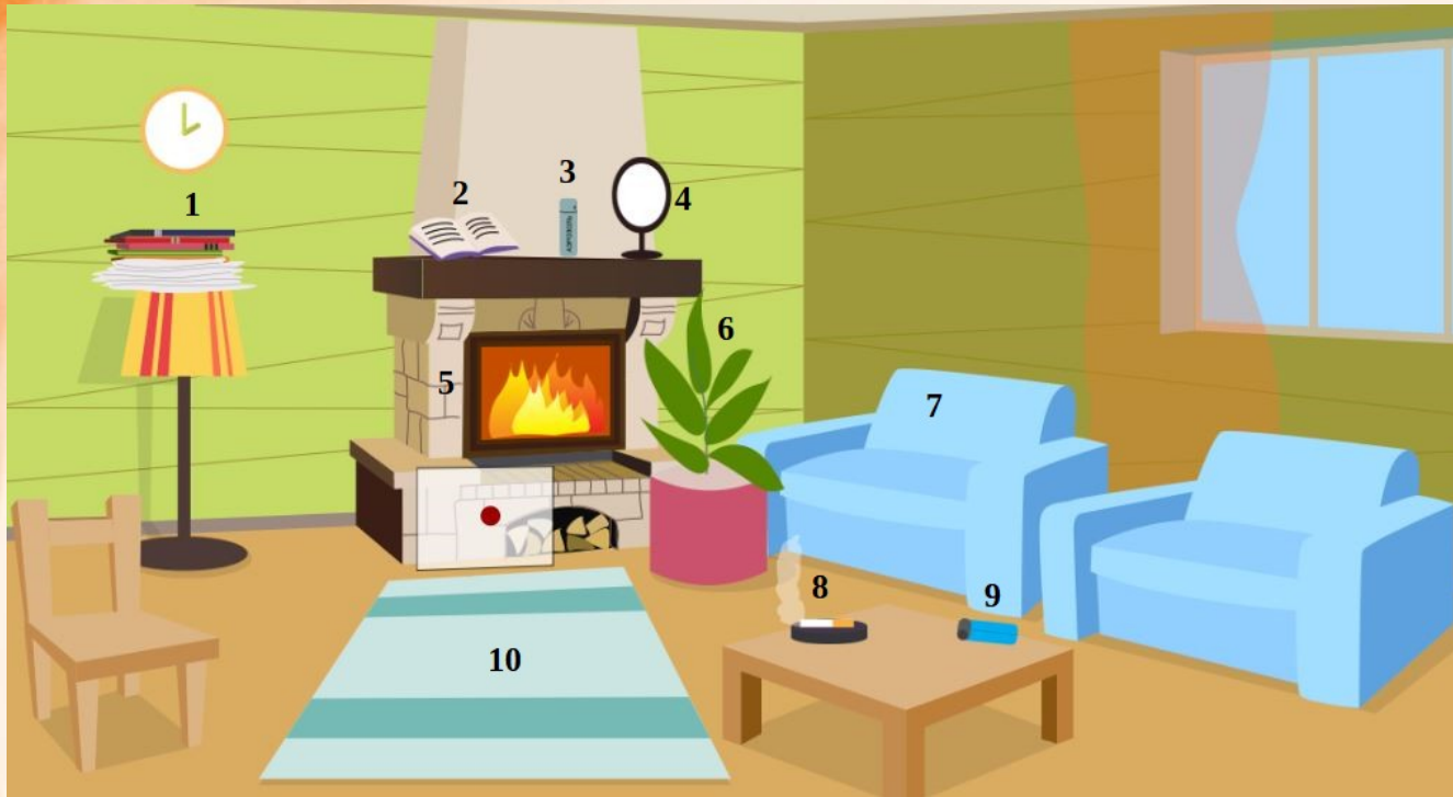
Рис. 4 Проверь найденные нарушения пожарной безопасности в гостиной